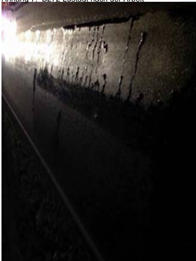
Anhang 7: B272 Lustadt nach der Arbeit