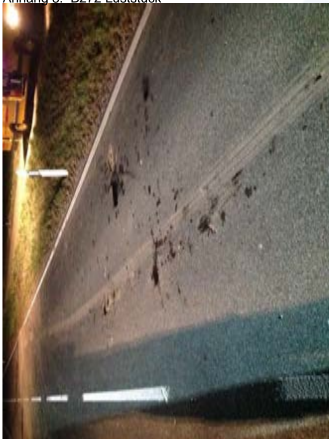
Anhang 3: B272 Luststück