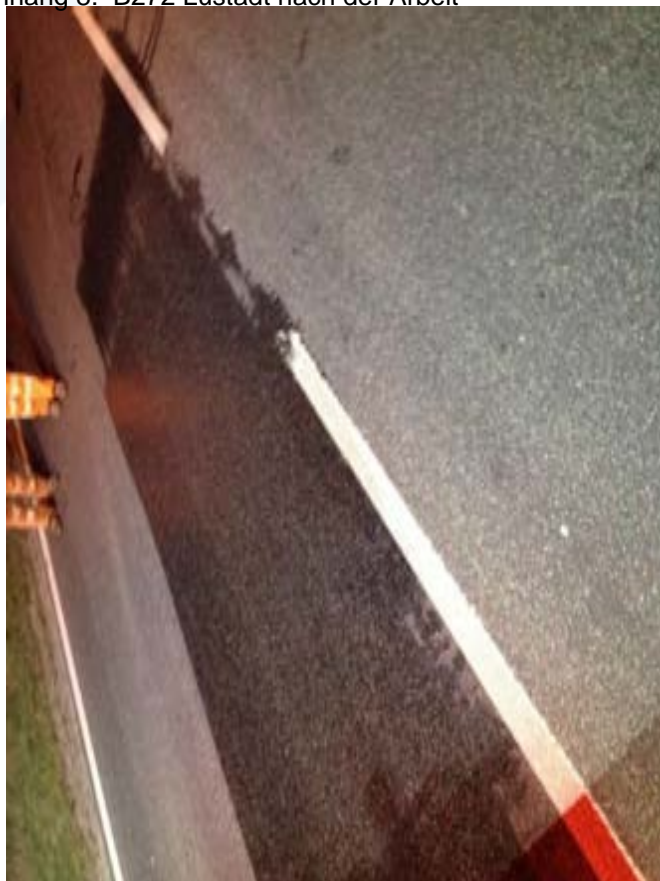
Anhang 8: B272 Lustadt nach der Arbeit