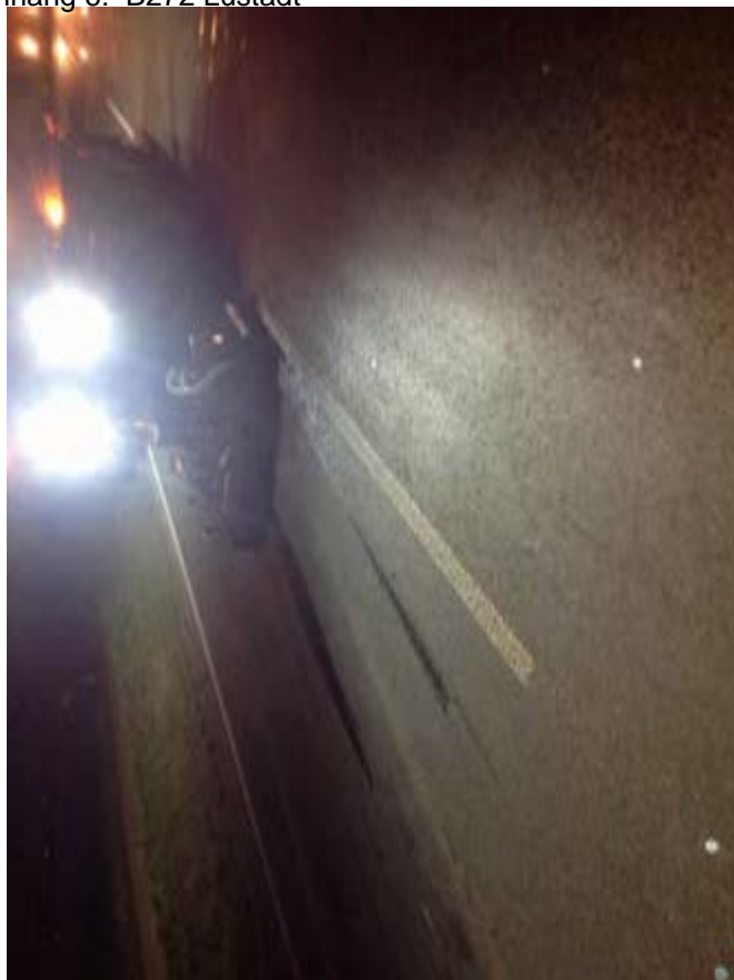
Anhang 6: B272 Lustadt