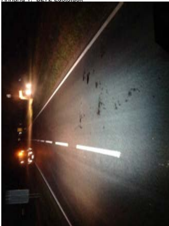
Anhang 1: B272 Luststück