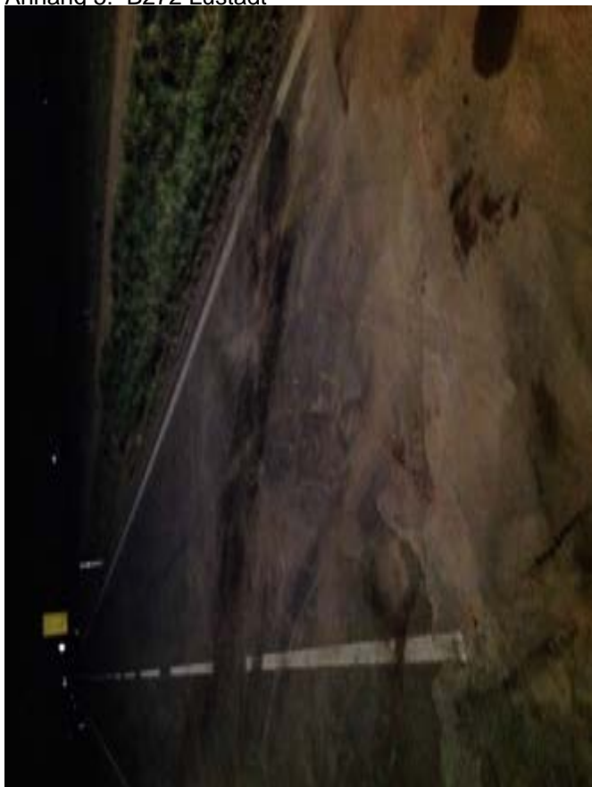
Anhang 5: B272 Lustadt