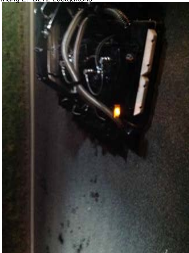
Anhang 2: B272 Lustgartens